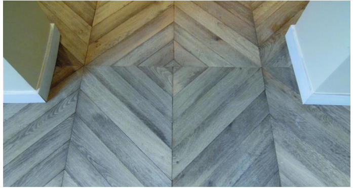
Parquet Point de Hongrie lessivé (Paris)

Fabrication de parquets haut-de-gamme sur mesure