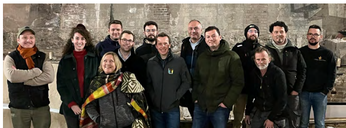
Groupe stagiaires formation CIP Patrimoine